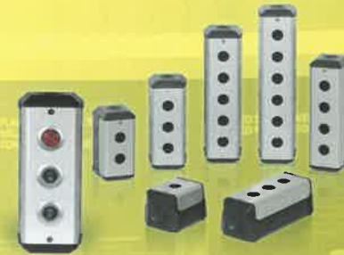
플라스틱 단자 박스 / 컨트롤 박스 / 턴라이트 (Plastic Box Series/ Control Box Series / Turn Light)